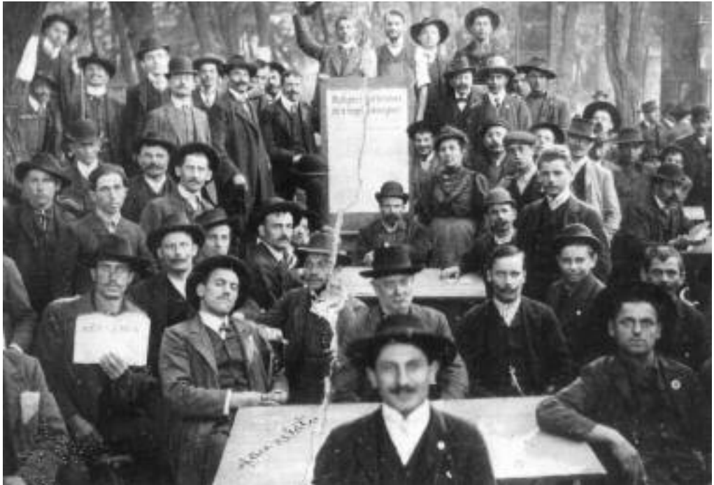
Kizárt bádogos és szerelő munkások a sztrájktyán 1907 augusztusában.