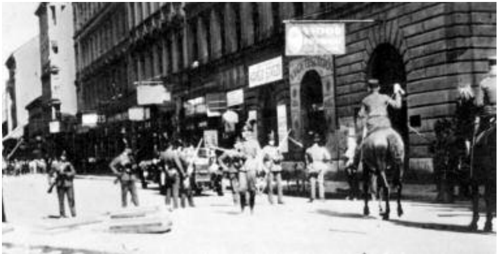
Karhatalmi készültség 1930. szeptember 1-jén.