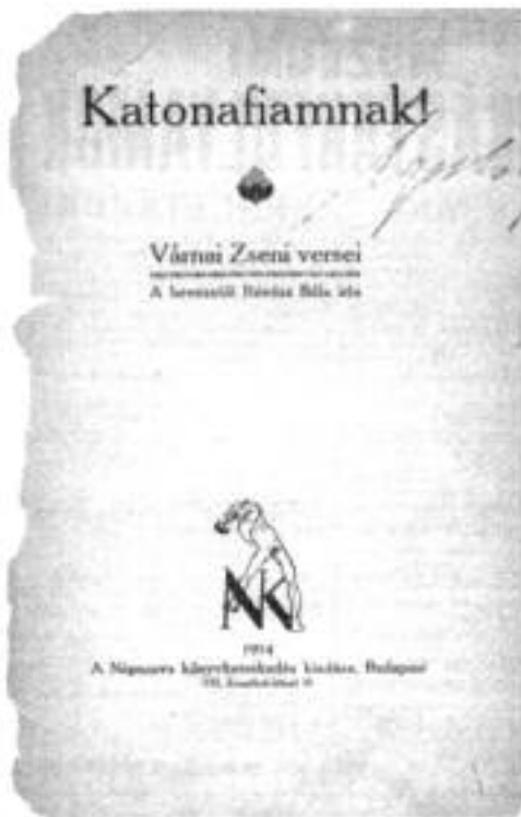
Tiltakozás a háború ellen!