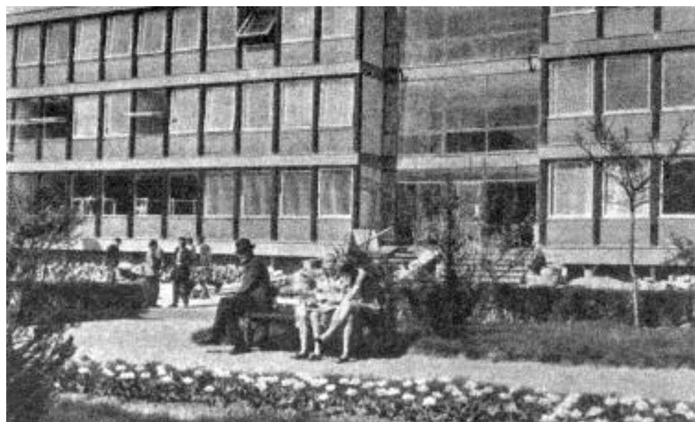
Szakszervezeti székház épült Salgótarjánban 1966-ban.