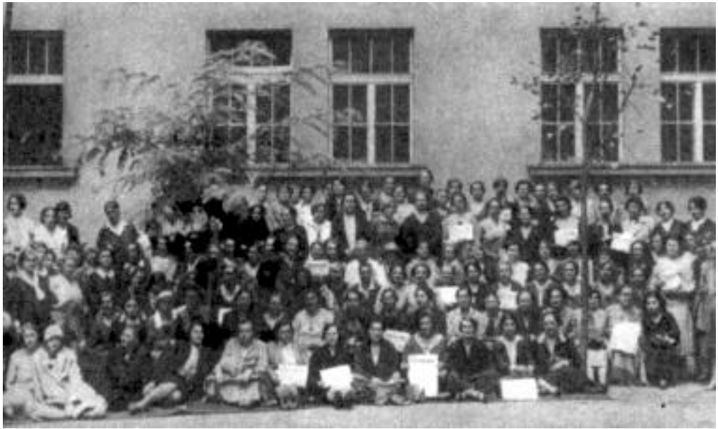
A szociáldemokrata nőkongresszus 1930. szeptember 7-én.