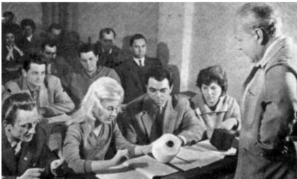
A Magyar Gyapjúfonó és Szövőgyárban kihelyezett technikumban folyik a tanítás az 1960-as években.