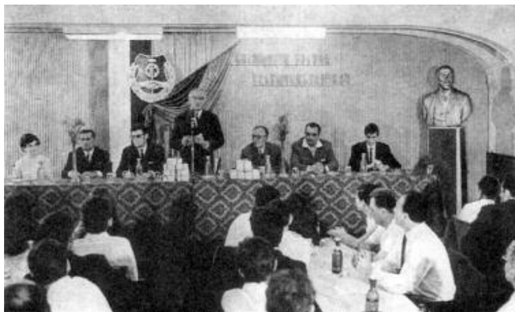
Vasas-szakmunkásokat avatnak a szövetség székházában, 1970-es években.