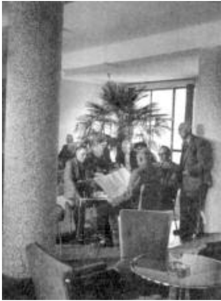
Kaposvári nyugdíjas klubban...