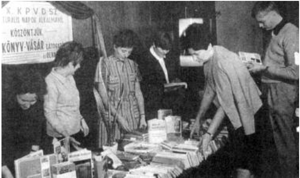
Könyvvásárlás 1970-ben a Kereskedelmi, Pénzügyi és Vendéglátóipari Dolgozók Szakszervezetében.