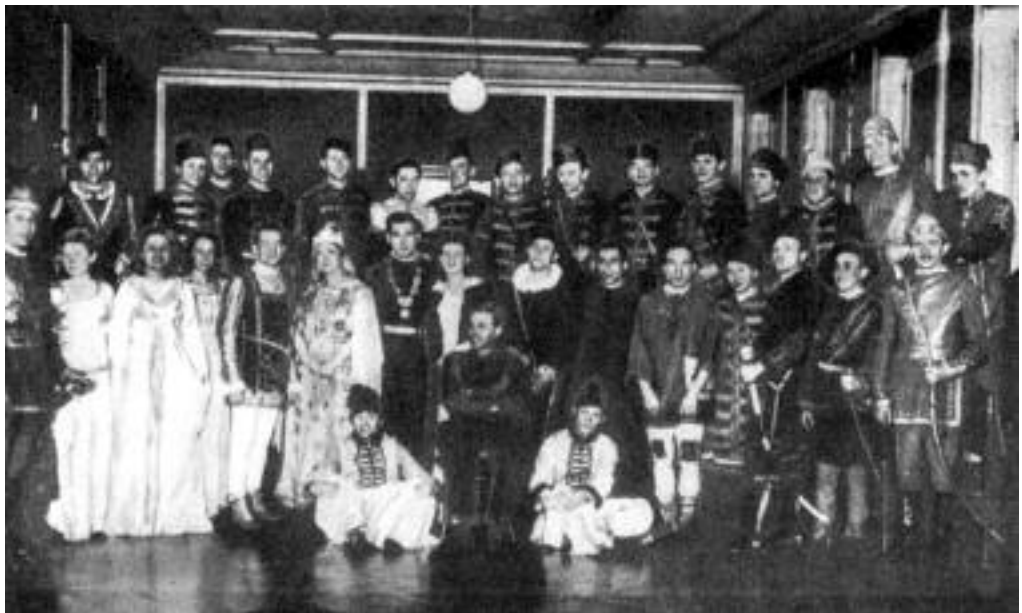
A bőrosszakszervezet legendás Bánk bán előadása 1942-ben tiltakozás volt a fasiszmus ellen.