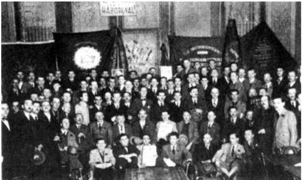
Tagavató ünnepség az építőknél 1940 szeptemberében.