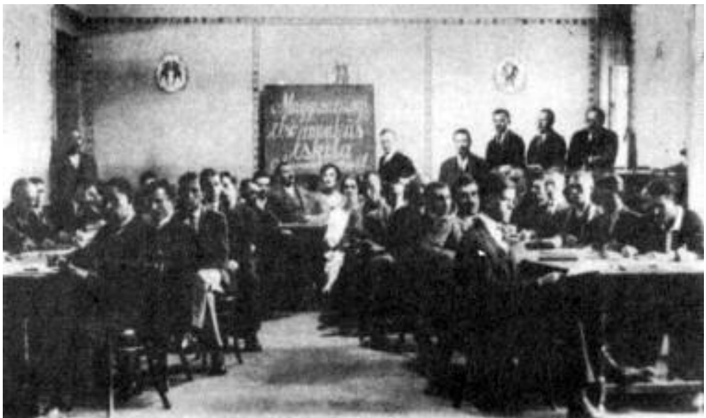
A fások munkásiskolája 1930 körül.