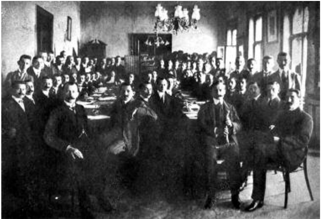
Szakszervezeti tanfolyam 1910-ben.