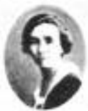
KÉTHLY ANNA (Debrecen 2.)