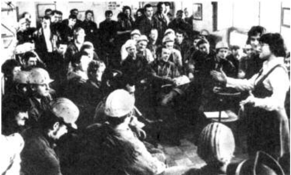
A Tatabányai Bányász Színpad irodalmi műsora, műszakváltáskor az 1980-as években.