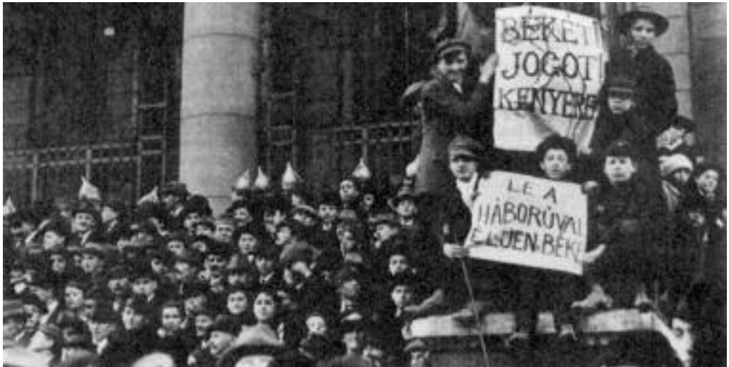
Háború ellenes tüntetés 1918-ban Budapesten.