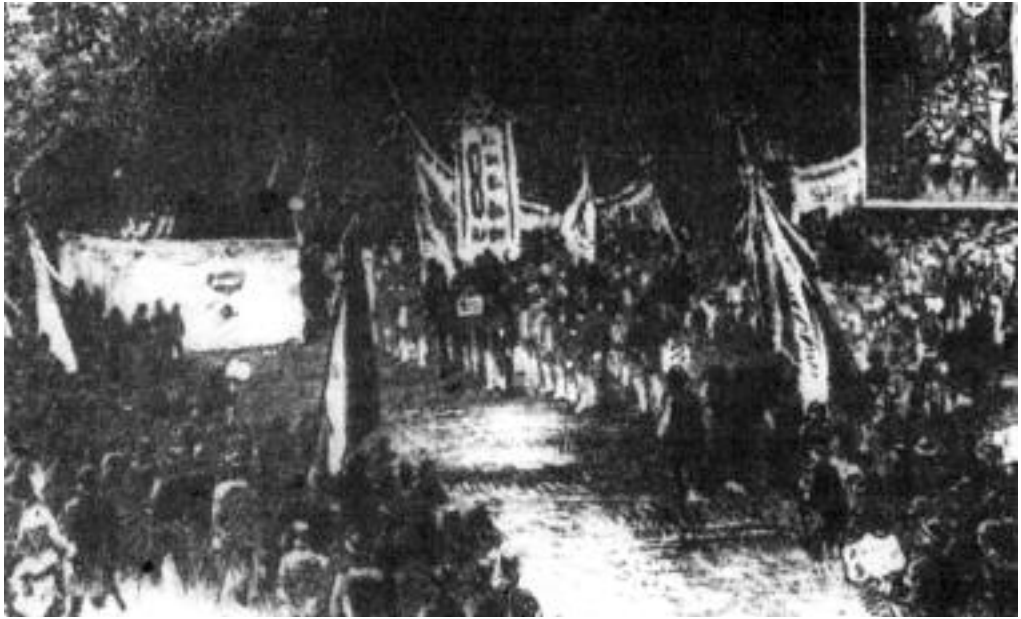
Az első május elseje 1890-ben Budapesten.