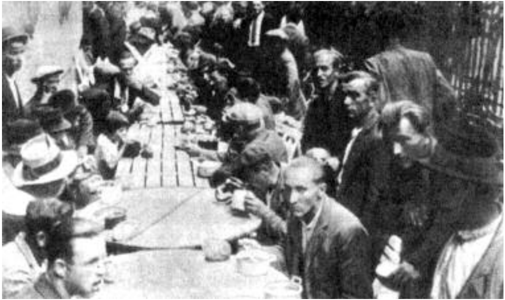
Az építőmunkások sztrájkantánya 1935-ben.