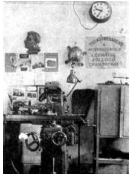
A munkaversenyben lemaradók „Teknősbéka” rendje 1950.