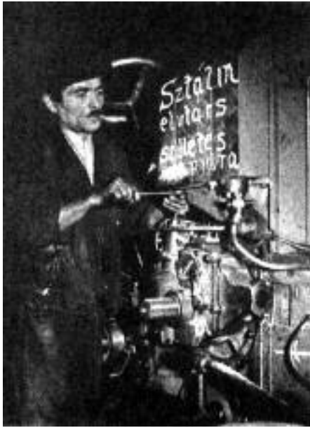
A „Sztálin műszak” 1949-ben.