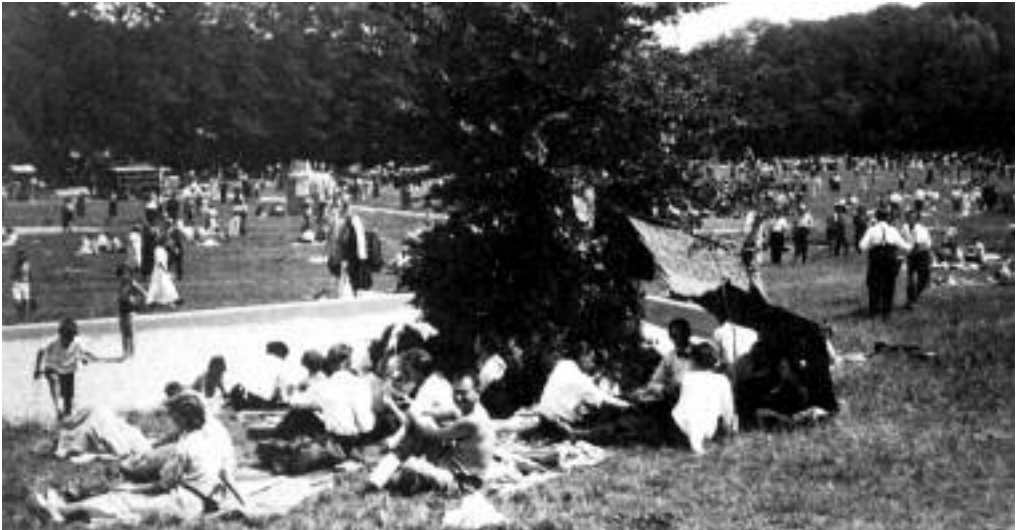
Május 1. a hűvösvölgyi Nagyréten az 1920-as években.