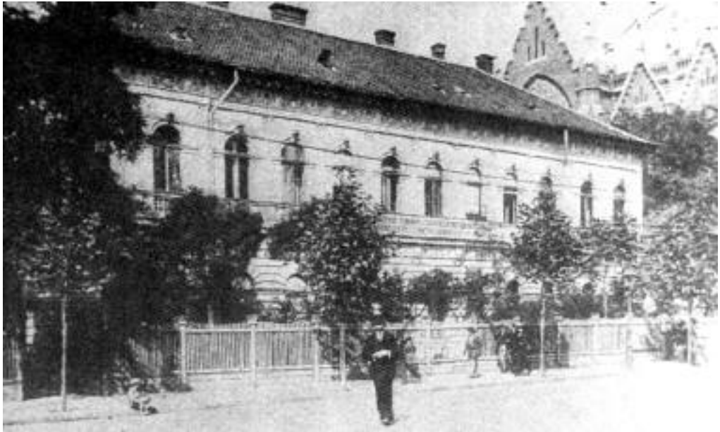
A vasasok Thököly úti székháza 1910-es években.