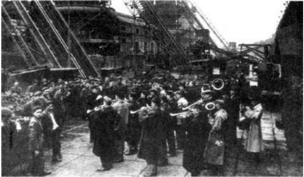
A gyári zenekar köszönti az Ózdi Kohászati Művek munkaversenyben előljáró dolgozóit 1954. március 27-én.