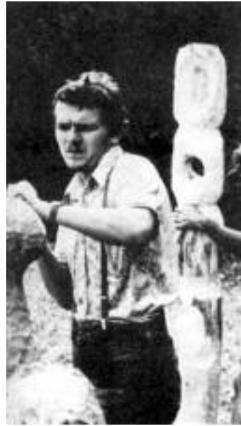
... fiatal munkásművészek alkotótábora Zalalövön...