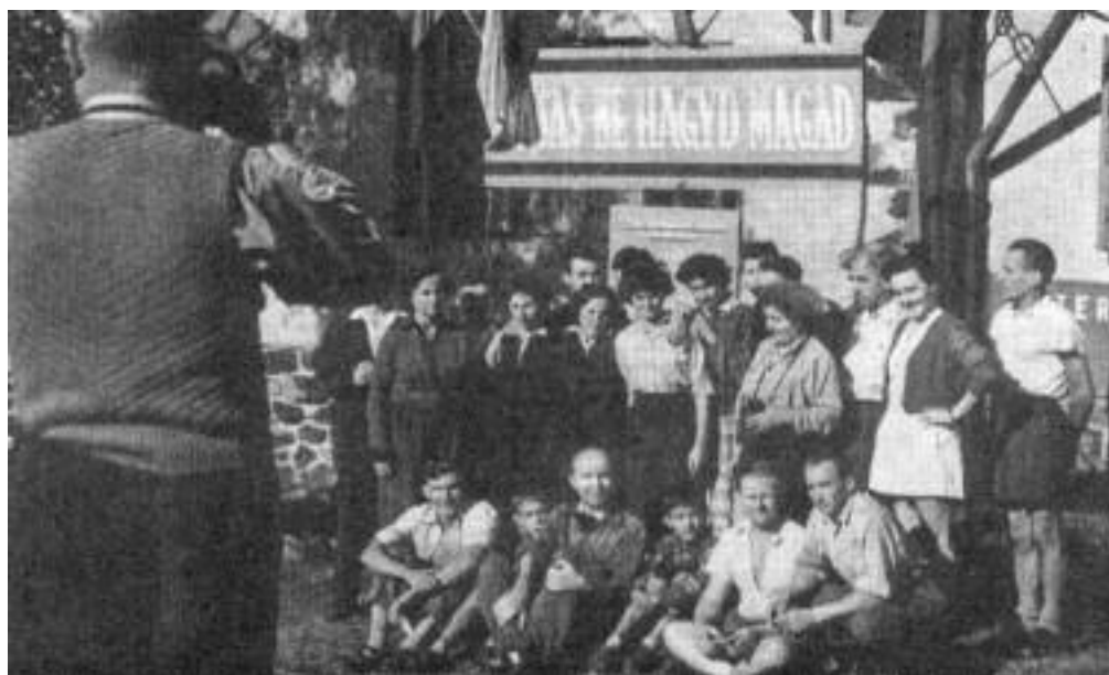
A Vasas Természetbaráti Egyesület országos találkozója Galyatetőn 1958. július.