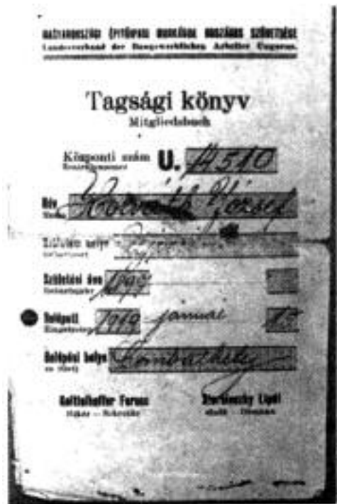
Az Építőmunkás szakszervezet tagsági könyve 1919.