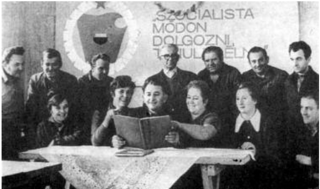
Szocialista brigád találkozó az Ózdi Kohászati Művekben 1972.