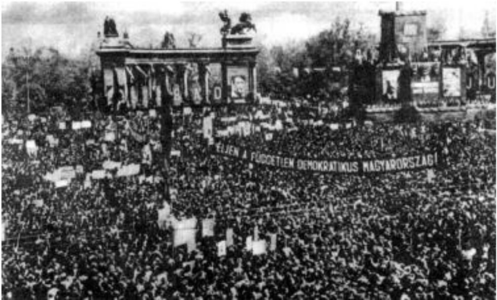
A háború utáni első Május 1. a fővárosban.