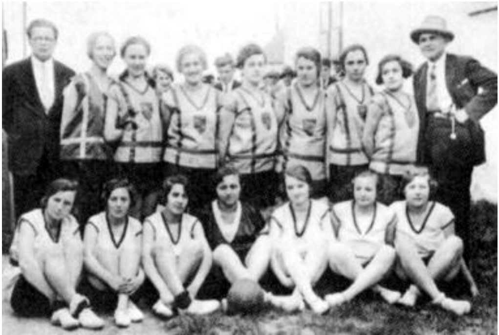
A MÉMOSZ „Barátság” női kézilabdacsapat 1928 április.